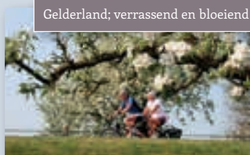
Gelderland; verrassend en bloeiend!