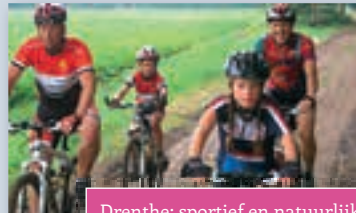
Drenthe; sportief en natuurlijk!