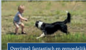
Overijssel; fantastisch en gemoedelijk!