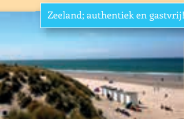
Zeeland; authentiek en gastvrij!