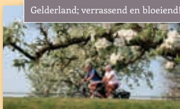
Gelderland; verrassend en bloeiend!