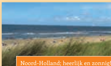
Noord-Holland; heerlijk en zonnig!