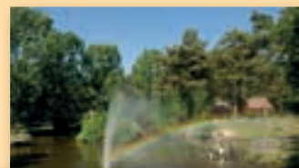
Limburg; onvergetelijk en mooi!