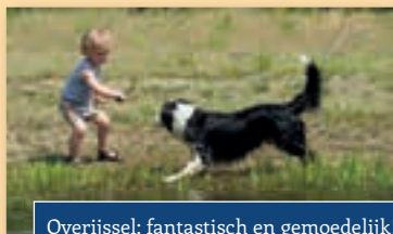
Overijssel; fantastisch en gemoedelijk!