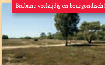
Brabant; veelzijdig en bourgondisch!